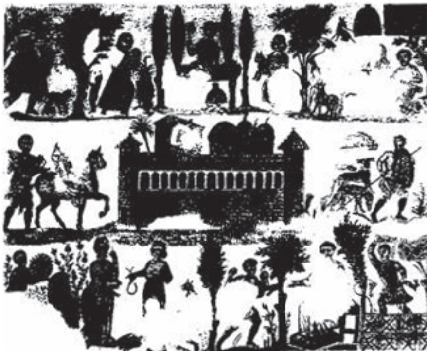
Figura 4. Cartago, mosaico do Dominus Julius . Final do Século IV d.C (Blanchard-Lemée, M. – Sols de l'Afrique romaine . Paris, Imprimerie Nationale, 1995, p. 170).

dos com finas vestes e de modo a se sobressaírem em relação aos demais personagens. A posição e modo de retrato das figuras atuam como “emblema” de um grupo de elite. Na parte superior do painel, a senhora da domus é figurada sentada num banco e se abanando com uma espécie de leque. Na imagem inferior do mosaico, a senhora aparece numa atitude que deliberadamente imita as representações da toailete de Vênus: a serva oferece à senhora um colar retirado da caixa de jóias. A roupa, provavelmente de seda pela fina textura que apresenta, e o diadema em sua cabeça atestam riqueza. Aos pés da senhora aparecem peixes que podem ter um sentido “profílató e de talismã” 3 , mas que também podem estar relacionados às imagens da Vênus Marinha. O proprietário da domus aparece igualmente retratado de modo imponente – na parte central do painel sobre um cavalo e na parte inferior num banco que se encontra sobre uma base (de modo a marcar