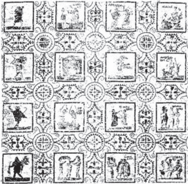
Figura 3. El Jem, mosaico de calendário. Século III d.C (Blanchard-Lemée, M. – Sols de l'Afrique romaine . Paris, Imprimerie Nationale, 1995, p. 46).

a presença do trabalho agrícola nos ciclos anuais. Embora a própria representação em si do trabalho agrícola faça uma referência implícita às estações em que ocorrem (por exemplo: pisoteamento das uvas – outono), não há neste pavimento o uso predeterminado de cenas do trabalho agrícola como “personificação” das estações do ano. As estações do ano aparecem no mosaico representadas em sua forma habitual: putti sobre animais selvagens.