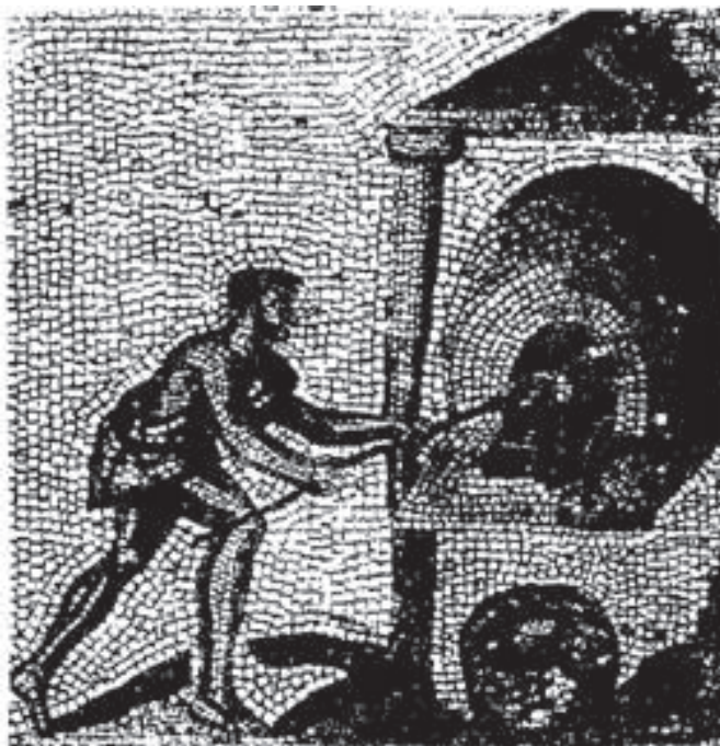
Figura 2. Narbona, mosaico com a imagem de um homem assando pães. Século II d.C. (Lancha, J. – Recueil général des mosaïques de la Gaule . Paris, CNRS. Vol. 2, 1981, pl. CVIII-CXXIII).

várias atividades rurais em forma de calendário 1 . As cenas retratadas no mosaico (semeadura das favas, moagem de grãos no moinho, transporte do estume, cozimento do pão, fabricação de cestos, enxerto de árvores, recolhimento de ramos mortos, coleta de maçãs, vindimas, pisoteamento das uvas, aradura dos campos, coleta das olivas, unção de potes, prensagem das olivas), conectam-se às figuras das estações do ano e às imagens de culto.