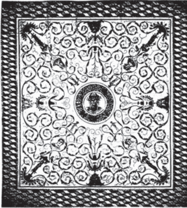
Figura 8. El Jem. Imagem de Annus e das quatro estações. Meados do século II d.C. (Blanchard-Lemée, M. – Sols de l'Afrique romaine . Paris, Imprimerie Nationale, 1995, p. 42).

popularidade: evocam tanto o tempo eterno quanto o tempo marcado pela periodicidade da natureza, exprimindo a harmonia do universo e a renovação perpétua dos seres. Outro aspecto realçado pelo autor é o da propaganda imperial: o Império romano seria eterno e constantemente renovável, tal qual os ciclos cósmicos e a sucessão das estações. O deus Aion, senhor do tempo eterno, surge retratado num mosaico norte africano de El Jem (fig. 1) enquanto figura central, ladeado por Apolo (Sol), Ártemis (Lua) e pelas figuras das estações do ano. Esta divindade opunha-se a Chronos: tempo relativo, conectado aos acontecimentos e destinos humanos.