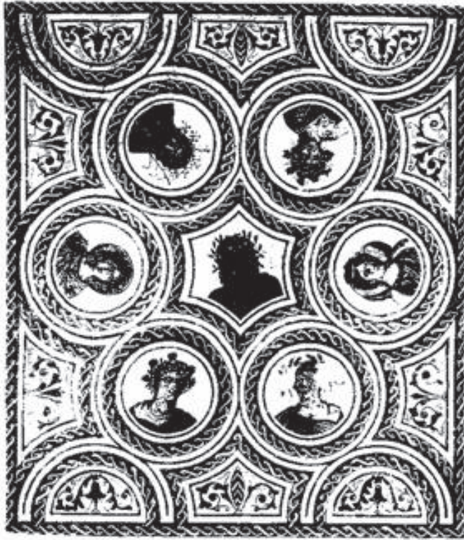
Figura 1. El Jem, mosaico com a imagem do deus Aion. Século III d.C. (Blanchard-Lemée, M. – Sols de l'Afrique romaine . Paris, Imprimerie Nationale, 1995, p. 38).

de um gesto que, se não fosse figurado, seria esquecido devido à própria natureza das ações humanas, que se não perpetuadas em documentos materiais ou textuais que as registrem ou se não constantemente lembradas (através de cultos, ritos), existiriam durante um definido espaço de tempo na mente de seus contemporâneos, mas não sobreviveriam na lembrança das gerações vindouras.