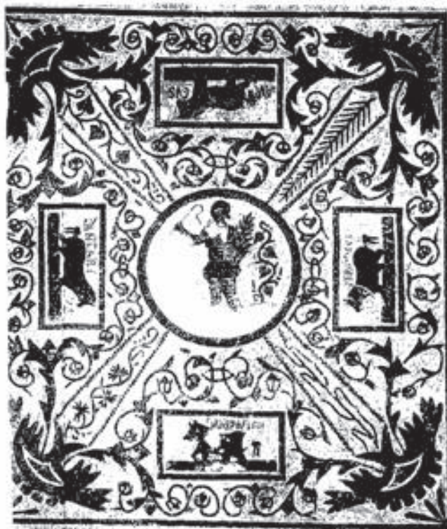
Figura 7. Douga. Imagem de auriga e de cavalos representando as estações do ano. Século IV d.C. (Fantar, M. – La mosaïque en Tunisie . Paris, CNRS. 1994, p. 188).

tral. Em quatro painéis retangulares, com menores dimensões que o painel central, surgem imagens de cavalos vencedores, com a inscrição de seus nomes: Pantarcus , Avreus , Terdiacus , Mapsaeron . Parte do painel central encontra-se danificado, não permitindo a identificação do auriga pelo seu nome. Os animais podem figurar tanto os quatro cavalos de uma mesma quadriga vencedora quanto representar (tal qual no mosaico gaulês) as estações do ano.