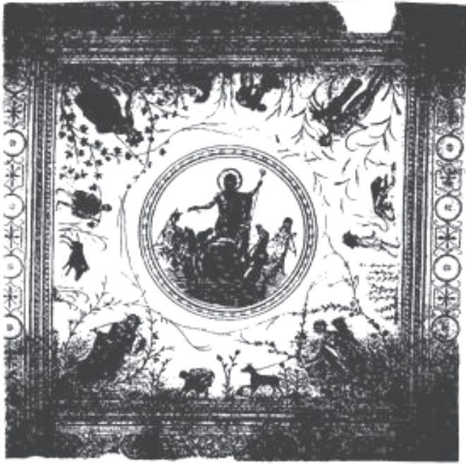
Figura 5. La Chebba. Imagem de Netuno e de trabalhos agrícolas. Século IV d.C (Blanchard-Lemée, M. – Sols de l'Afrique romaine . Paris, Imprimerie Nationale, 1995, p. 132).

facções e, embora em Roma as mais conhecidas fossem a vermelha e a branca, no começo do século I d.C. duas outras apareceram: a verde e a azul. Estas quatro facções atuaram até o início do século II d.C., quando a facção azul integrou-se à vermelha e a verde à branca. A permanência da representação das quatro facções em mosaicos gauleses e africanos dos séculos III e IV d.C., demonstra que as quadrigas foram utilizadas com o propósito de simbolizar as estações do ano: verde (primavera), vermelha (verão), azul (outono), branca (inverno).